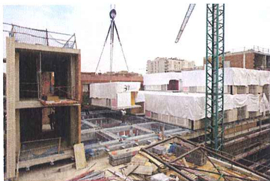
Las obras dieron comienzo el martes

La empresa Compact Habit ha trabajado durante los últimos cuatro años invirtiendo más de 8 millones de euros en investigación y desarrollo de este nuevo concepto de edificación . La residencia contará con dos plantas de 18 módulos cada una , y se edificará en tan sólo seis días, realizando una impresionante operación con grúas de grandes dimensiones .