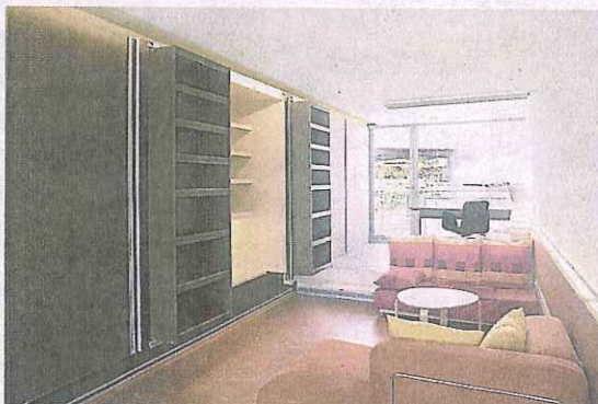
Imaginativa decoración interior de uno de los pisos contenedor