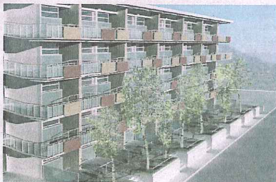
Así queda el bloque de pisos una vez apilados los contenedores