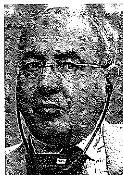
Mohamed Meziane