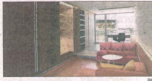
INTERIOR. Aquesta és una de les possibilitats dels pisos.