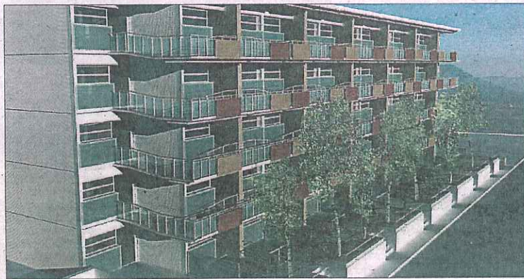
SIMULACIÓ. Imatge virtual d'una promoció de Compact Habit, similar a la que es construirà a Banyoles.

La companyia afegeix que la fabricació íntegral en una fàbrica de mòduls permet eliminar alguns dels processos més lents de la construcció tradicional, com els tancaments exteriors, els acabats interiors, les ins-